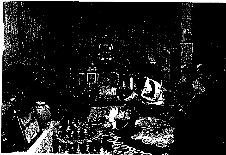
ทำบุญวันปีใหม่ วัดดอยสะเก็น อำเภอเมือง จังหวัดเชียงราย